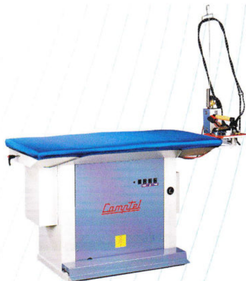
Table de repassage aspirante et chauffante (Mod 64), avec ou sans chaudière. Avec soufflerie dans la serie Mod 65.

Vacuum and heating ironing board (Mod 64) with or without built-in steam boiler. Version Mod 65 also includes blowing action.