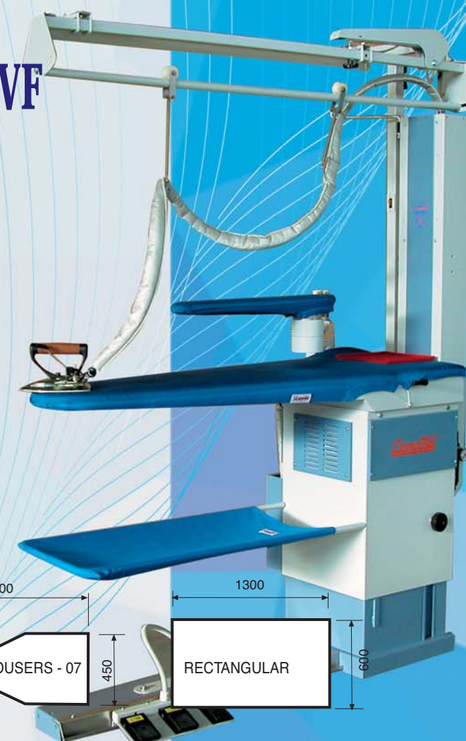
EUROPA Mod 63 VF